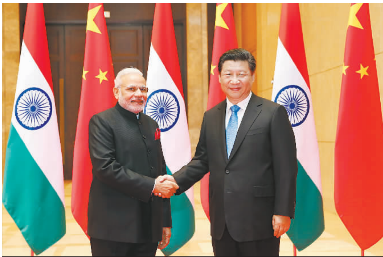
5月14日,国家主席习近平在西安会见印度总理莫迪。

习近平为此提出4点建议:一要从战略高度和两国关系长远发展角度看待和处理中印关系,加强国际和地区事务中的战略协作,携手推动国际秩序朝着更加公正合理方向发展。双方可以就“一带一路”、亚洲基础设施投资银行等合作倡议以及莫迪总理提出的“向东行动”政策加强沟通,找准利益契合点,实现对接,探讨互利共赢的合作模式,促进共同发展。二要更加紧密地对接各自发展战略,实现两大经济体在更高层次上的互补互助,继续成为地区乃至世界经济增长“双引擎”,携手推动地区经济一体化进程,为全球经济增长作出积极贡献。要重点推动铁路、产业园区等领域合作,探讨在新型城镇化、人力资源培训等领域拓展合作。中方鼓励中国企业赴印投资,希望印方积极为此提供便利。三要共同努力增进两国互信,管控好分歧和问题,避免两国关系大局受到干扰。四要鼓励两国各界加强交往,增进了解,实施好中印文化交流计划和印度旅游年活动,继续加强智库、媒体、青年交流,扩大地方友好往来,推动构建两国全方位、多层次的人文合作大格局,使中印友好和合