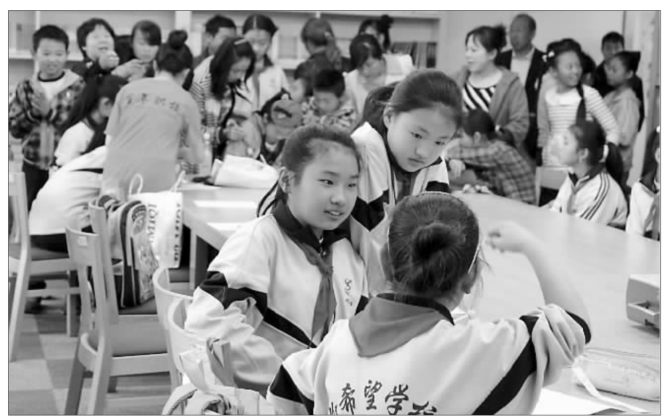
图为孩子们在照相。