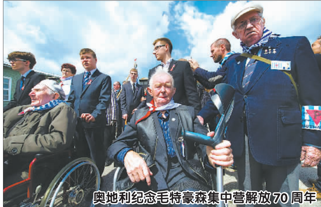
奥地利纪念毛特豪森集中营解放70周年

大臣兼大法官,原司法大臣克里斯·格雷林改任议会下院领袖兼枢密院议长,教育大臣尼克·摩根也继续留任。这是自1997年以来首个完全由保守党成员组成的内阁。卡梅伦虽然连任首相,但英国媒体认为新政府的任务仍然艰巨,其中最棘手的是苏格兰独立和英国脱离欧盟两个问题。苏格兰民族党领袖斯特金在胜选后表示,苏格兰的政治版图已经发生了重大变化,“在苏格兰,改变的声音越来越高”。而作为苏格兰民族党胜利的间接受益者,卡梅伦10日表示,会着手兑现承诺,给予苏格兰更大的自主权,但不会再有下一次苏格兰独立公投。卡梅伦还表示,会按照计划推进脱欧公投。就在卡梅伦组阁的同时,在选举中遭遇挫折的其他政党也有大变动。工党领袖米利班德、自由民主党主席克莱格和英国独立党主席法拉奇均在选举结束后辞职。本次大选还刺激英国民调机构做出反省。对于民调结果与选民投票结果大相径庭的现象,英国民意调查委员会总裁、知名选举问题专家柯蒂斯认为,一种可能是选民在最后一分钟大幅转向保守党,另一种可能是民调有问题,柯蒂斯说,该委员会将成立一个由无党派统计专家领导的调查团研究问题出在哪里。