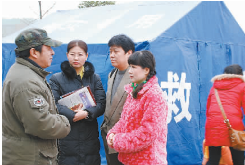
陕西省职工文艺小分队春节期间慰问灾区职工群众

“让优秀的文化更好地为基层、为职工服务,这是我们陕西工会人孜孜不倦的追求和责无旁贷的使命,唯此才无愧于这块古老的土地和伟大的时代。”周树红如此说。