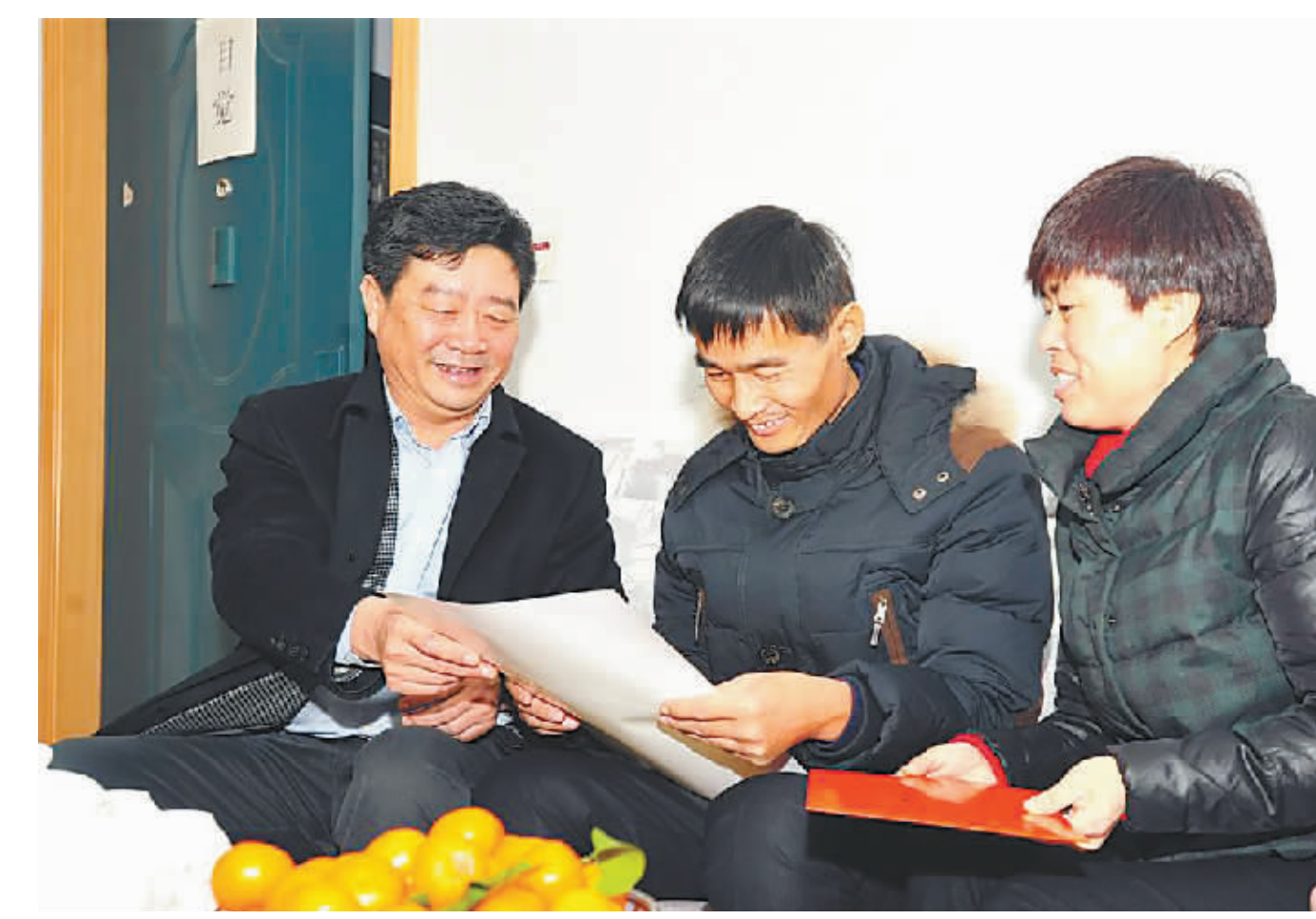
在“最美职工”吴吉林家中，省总工会党组书记、常务副主席刘贺杰亲切询问他的生活、工作情况，嘱咐他要保重身体，注意休息，并鼓励他再接再厉，争取今后推出更多的创新成果。

实施的关键，山东完善群众性安全生产考核奖惩机制，省总每年都列出专项资金，对举报重大安全事故隐患、职业危害者进行奖励。此项活动还与工会组织开展的“评先创优”工作挂钩，纳入工作考核和工会干部表彰奖励的重要条件，纳入各级劳动模范和劳动奖章（奖状）、工人先锋号等评选的重要条件。对发生安全生产责任事故或严重职业危害的企业及其负责人，工会组织不授予其荣誉称号。 “职工的生命安全比天大。”刘贺表示， “查保促”活动的开展，是新形势下工会围绕中心、服务大局的切入点，是工会发挥优势、彰显作为、提高地位的新亮点，要把组织职工排查安全隐患作为全省工会的一项品牌工作，纳入日常工作，长期坚持下去。