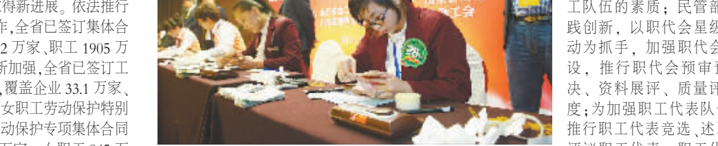
省总广泛开展全省职工技术创新竞赛活动。去年以来开展了8项省级重点工程示范性竞赛，举办了72个行业的行业性职工职业技能竞赛和17个行业的节能减排达标竞赛。