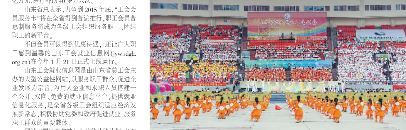
为丰富全省职工业余文化生活，省总先后举办了六届职工运动会，今年，将围绕纪念抗日战争胜利70周年，省总工会成立75周年，举办全省职工书画展等活动。推进工人文化宫改革发展，务实阵地地开展好职工喜闻乐见的文体活动，增强工会的凝聚力和向心力。

不但会员可以得到优惠待遇，还让广大职工感到温暖的山东工会就业信息网(gw.sdgh.org.cn)在今年1月21日正式上线运行。 山东工会就业信息网是由山东省总工会主办的大型公益性网站，以服务职工群众、促进企业发展为宗旨，为用人单位和求职者搭建一个公开、双向、免费的就业信息平台，提供就业信息服务，是全省各级工会组织适应经济社会发展新常态，积极协助党委和政府促进就业、服务职工群众的重要载体。 网站主要发布与就业相关的法律法规，发布各地求职人员的需求信息、发布各类用人单位招聘信息、开展求职人员和用人单位需求信息查询检索、举办网上招聘等。网站依托全省各级工会