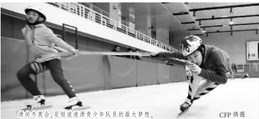
滑向冬奥会,是短道速滑青少年队员的最大梦想。

有一句流传甚广的名言:体育拥有改变世界的力量。而体育是如何改变世界的?就是通过它的软实力来实现的。