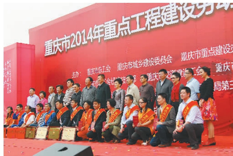
重庆市人大常委会副主任、市总工会主席郑洪出席重庆市2014年重点工程建设劳动竞赛启动仪式

市总工会常务副主席黄建国告诉记者,作为重庆“十大民生”工程之一,公租房建设受到了极大的关注,它为众多进城农民工、中低收入群体解决了住房困难问题,所以,投身重庆公租房建设工程的每一位职工,都感到重任在肩。劳动竞赛进行期间,领导小组将适时组织抽查,每年度评比表彰一批优秀组织奖、先进单位奖、优秀工程项目奖、优秀建设者和突出贡献奖。