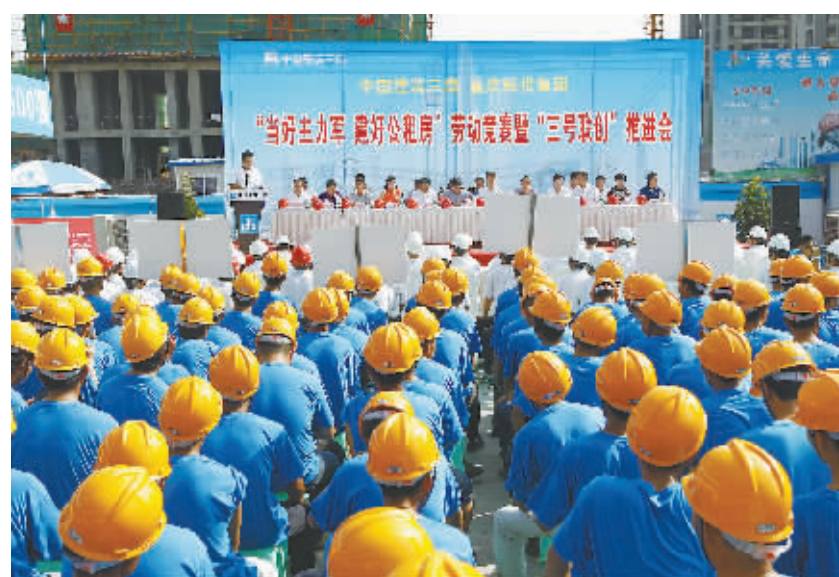
重庆市建好公租房劳动竞赛推进会