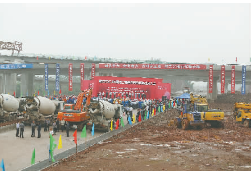
重庆市2014年重点工程建设劳动竞赛动员大会

像重庆万利万达高速公路有限公司这样通过劳动竞赛作出突出贡献的单位,在重庆各个行业领域还有很多,每一位建设者在如火如荼的劳动竞赛的带动下,干劲和激情被充分地激发了出来,三大劳动竞赛给重庆的建设发展注入了全新的动力。重庆市人大常委会副主任、市总工会主席郑洪欣慰地表示,劳动竞赛有力地推动了重庆建设事业的发展,涌现出了无数优秀的先进模范,也展现出了开拓创新、自强不息的工人阶级伟大品格。同时,郑洪指出,劳动竞赛在2015年还将继续开展下去,让更多的劳动者加入进来,把竞赛活动作为展示自我才能、学习先进典型、提高自身素质的重要平台,进一步掀起学先进、比先进、赶先进、争先进的劳动热潮。