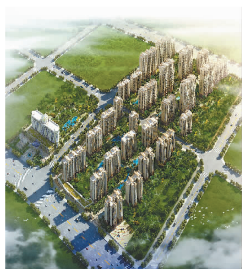
裕通花园鸟瞰图(效果图)

如今，在张钦洲领导下，裕通控股集团旗下的裕通建工集团已发展为具备国家总承包一级资质的建设集团，并获得国家、省市级认证的多个奖项和证书。而张钦洲本人，也早已从一个泥水工成长为建筑高级工程师、国家一级建造师，先后荣获“中国建筑市场功勋人物奖”、“广东省优秀民营企业家”、“感动中国百名优秀企业家”等多项荣誉。