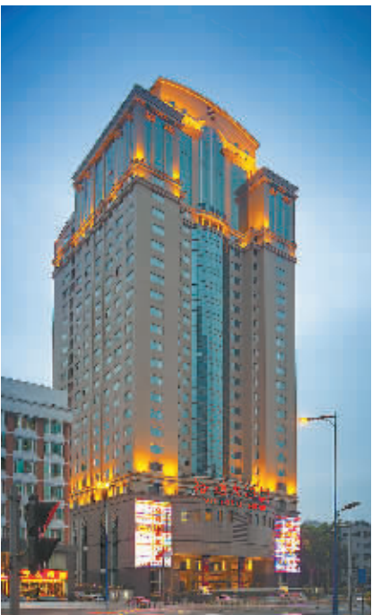
广东裕通大酒店外景