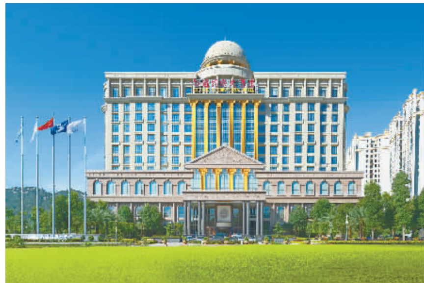
汕头裕通国际大酒店外景

张钦洲强调，就建立百年企业而言，一方面要加强制度建设，建立专业化的人才队伍，规范管理；另一方面，要强化企业的“软性”治理，也就是以“人本”理念为核心，加强企业文化的建设，特别是员工文化的建设。我们要立志把裕通建设成为每位员工享受事业和生命价值的“大家庭”，在这个“大家庭”里，每位员工都能充分施展自己的才能，都能获得相应的回报。