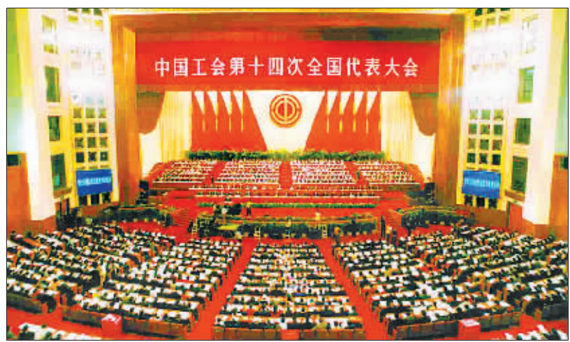
2003年9月22日至26日,中国工会十四大在北京召开。

2003年9月28日,胡锦涛同全总新一届领导班子成员和工会十四大部分代表座谈,强调全面建设小康社会,是全党全国人民在新世纪新阶段的历史任务,也必然是新世纪新阶段我国工人运动的主题。(下转第3版)