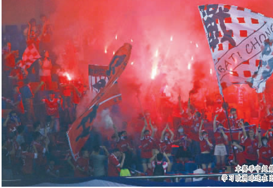
本赛季中超第4轮,重庆力帆主场对阵杭州绿城,重庆球迷学习欧洲球迷在地震中燃放烟火,场面火爆。

虽然本赛季的前5轮比赛未尝胜绩,但山城球迷对于重庆力帆依然不改痴心。据统计,在力帆本赛季的前3个主场比赛中,重庆奥体中心分别涌进了39000、48500和28900多名球迷。阔别4年重返中超的力帆,再次将重庆变成中国足球顶级联赛的“金牌球市”。不过,人声鼎沸的山城球市,却因为球迷组织纷杂,加油口号不统一,部分球迷缺乏耐心和包容等不足,并未能成为助力球队争胜的“最佳十二人”。在本赛季第2轮比赛主场输给广州恒大后,有力帆球员在接受采访时