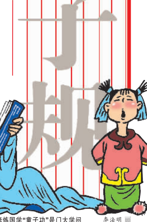
修炼国学“童子功”是门大学问