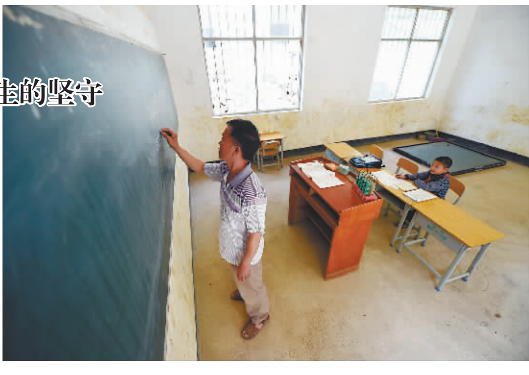
“城市稻草人” 李法明画