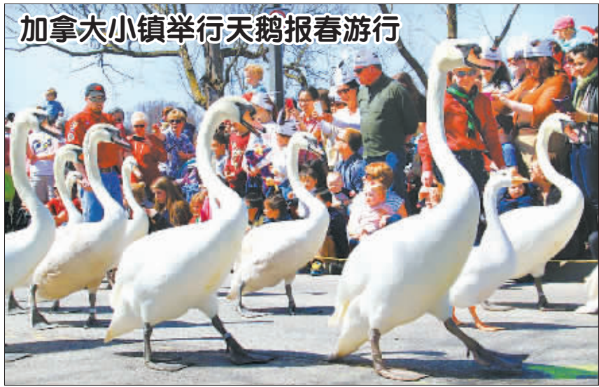
加拿大小镇举行天鹅报春游行

分析人士认为,自民党在去年举行的一些县知事选举中曾遭连败,这次选举获胜有助其扭转颓势。同时,统一地方选举被认为是对安倍政权的一次“大考”,如果自民党顺利拿下上下两个半场,将会为安倍在今年9月连任自民党总裁选举增加砝码,也对自民党出战明年的参议院选举有利。而安倍一旦能够长期执政,无疑将会加速推进其安保政策。