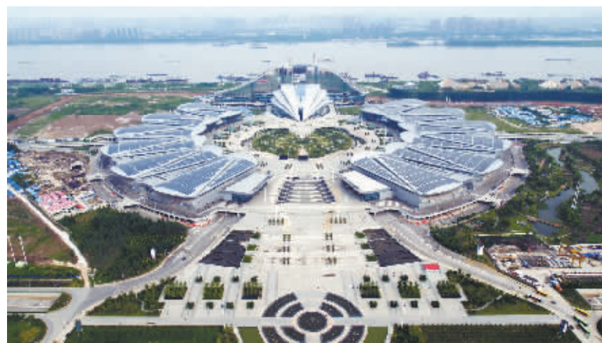
华中最大展馆——武汉国际博览中心展馆