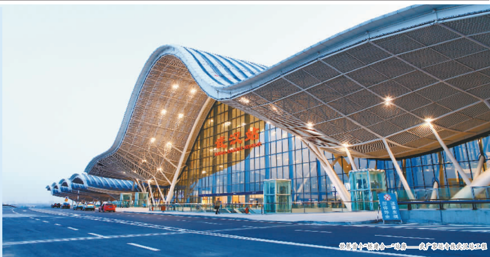
世界首个“桥建合一”站房——武汉客运专线武汉站工程

从世界首个“桥建合一”站房——武汉火车站到中国结构第一高楼——天津117大厦,从华中最大展馆——武汉国际博览中心到华中最大单体建筑——天河机场T3航站楼……20年来,总包人创造了500多座丰碑,它们或雄踞闹市,或静卧远郊,或屹立于江河两岸,或横亘在湖海之上。这些作品是总包公司与一个个城市走过的精彩征程,更是中国在世纪之交筑造的一座座建筑年轮。