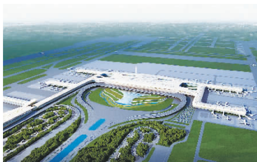
华中地区唯一拥有双跑道机场——武汉天河机场T3航站楼工程

强科技研发,打造BIM技术核心竞争力,推动建筑产业化发展,在绿色建筑施工方面引领潮流,一系列创新技术成果不断引领行业技术发展。