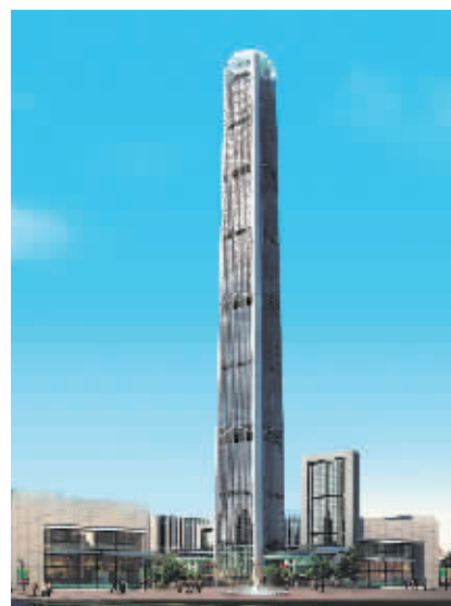
中国结构第一高楼、中国最大单体建筑——天津117大厦

塔,首次在中国北方房建领域使用远程质量验收系统;在高438米的武汉中心,自主研发的智能施工平台开业内之先河。公司持续加