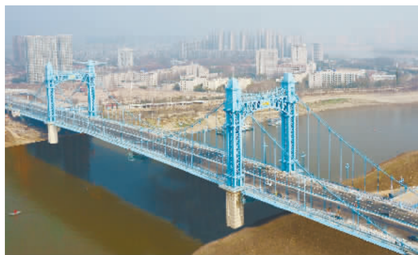
武汉市首座自锚式悬索桥——武汉江汉六桥