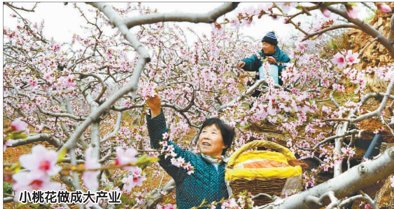
小桃花做成大产业

据悉,昂际航电现阶段首要任务是确保 C919 国产大飞机航电系统的集成测试及飞行相关产品设备交付,为 C919 首飞提供全力支持。