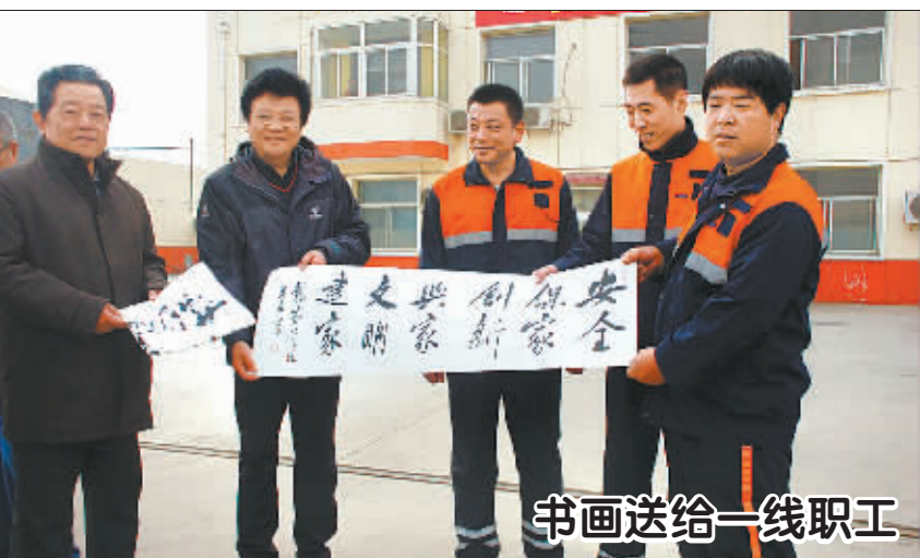
书画送给一线职工