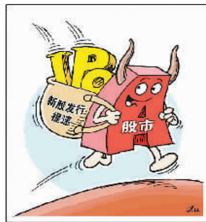
势头不减 新华社发 陈峻作

从年初一次给 20 家企业发放 IPO 批文,到之后连续两个月的 24 家,再到 4 月份的 30 家,种种迹象表明,今年以来,伴随着 A 股股指持续走高,新股发行节奏正在悄然加快。当前,人们最为担心的是,如果新股发行大幅提速,会不会影响股市走势?