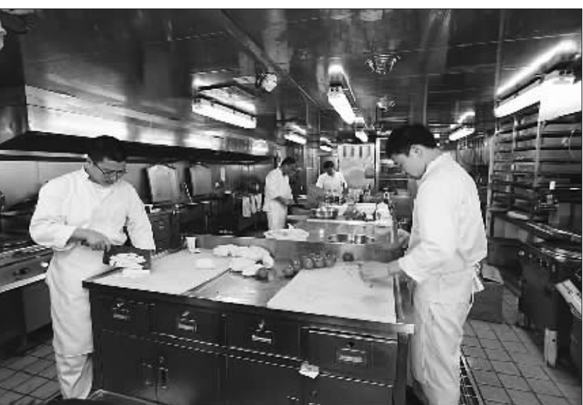
“雪龙”号科考队员的日常生活

“雪龙”号的厨师在为科考队员备餐(4月3日摄)。船上154名队员的一日三餐都由5名厨师准备。“雪龙”号厨师的工作很繁重,一顿饭能用掉100多个鸡蛋,50多个土豆,他们在多年的航海生活中已经练就了一手在颠簸中切菜炒菜的“绝活”。