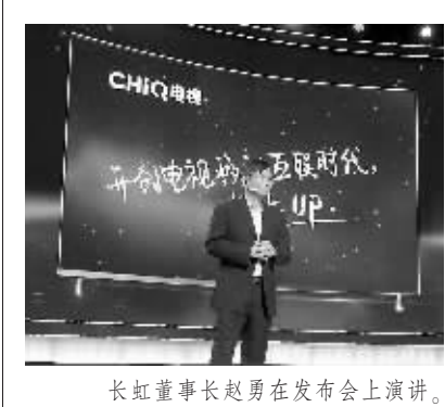
长虹董事长赵勇在发布会上演讲。

左广成说,他虽然不年轻了,但还是想一直坚守在这个共青团车站,用自己的青春年华努力工作,践行诠释青石崖铁路人凝聚的青石崖艰苦奋斗的创业精神、一丝不苟的工作精神、埋头苦干的奉献精神。 (于海 冯建博)