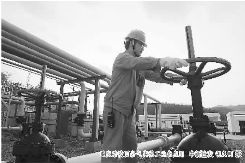
重庆涪陵页岩气实现工业化应用

“2009年,重庆率先启动全国首个页岩气资源勘查项目,被国土资源部列为国家页岩气资源勘查先导区。2012年11月,中石化在位于涪陵的焦页1HF井钻获高产页岩气流。”全国政协委员、重庆市林业局副局长张洪介绍,重庆天然气管网体系较为完整,国家骨干网与重庆主干网互联互通,且重庆主干网基本形成了较为完善的集、输、储、配四级天然气管网系统,输配能力达3600万立方米/日,为大规模页岩气的输送和应用奠定了基础,同时,拥有国内外大部分已经工业化的天然气化工工艺技术,对页岩气的充分利用具有明显优势。另一方面,重庆是国家老工业基地之一,装备制造产业是传统优势产业和支柱产业,已形成门类齐全、具有一定规模和水平的产业基地,具备发展钻井、井上装备、仪器仪表、LNG设备、水处理等页岩气产业装备的基础条件。