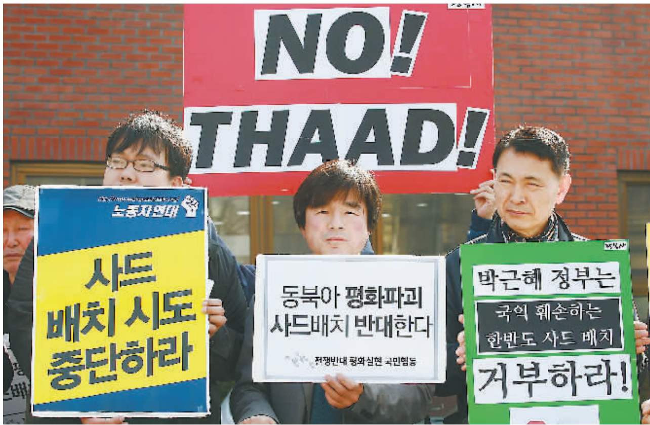
3月19日,韩国首尔,民众举行示威活动,抗议政府军事政策,反对美国在韩部署“萨德”系统。