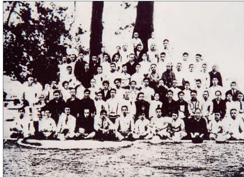
参加一次劳大的部分代表合影。(资料图片)

工人大罢工,经过5天即取得胜利。1923年2月4日,爆发了京汉铁路大罢工,反动军阀对工人进行了残酷的镇压,造成中国工运史上最悲壮的“二七”惨案,标志着中国工人运动