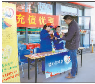
为普及油品知识,倡导绿色消费,中国石化安徽淮北石油分公司近日开展了“油品知识进万家”质量宣传活动。他们在加油站设立“爱心服务台”,免费向车主普及油品使用和车辆保养知识……因为加油站员工向车主介绍如何鉴别油品的优劣。

记者了解到,今年各地交通部门推出“互联网+服务”使得百姓出行更便利。深圳福田汽车站推出手机微信购票等多种网络购票服务,春运期间旅客微信购票率超过10%,网络非窗口售票率达25%;宁波市开通了“宁波通”,融合交通、交警、城管、气象等综合交通信息,通过手机向旅客提供线路查询、路况信息、手机购票等18项服务。