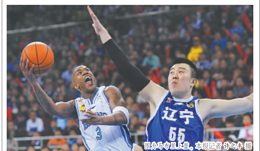
图为马布里上篮。

整合 | 世界跳水系列赛亮相水立方 本报讯(记者邱成)为期3天的2015年国际泳联世界跳水系列赛(北京站)于3月15日在国家游泳中心(水立方)落幕。主场作战的中国跳水队在10个项目的竞争中包揽全部金牌。 国际泳联世界跳水系列赛自2007年创办,今年与往年一样分6站进行,北京站为首站。本站比赛共吸引了来自13个国家和地区的73名运动员。 在本次比赛的10个项目,最大的亮点无疑是男女混合双人三米跳板/跳台的首次亮相。结果,仅有的三对参赛组合中国、加拿大及墨西哥瓜分了混双三米跳板的金银铜牌。据了解,这两个项目将于今年6月成为世锦赛的正式比赛项目。 中日围棋对抗赛中 中方12连胜 本报讯(记者李元浩)3月15日,记者从中国棋院获悉,在周末进行的第16届“阿含桐山杯”中日围棋对抗赛中,中国棋手柯洁执白146手中盘击败日本棋手井山裕太,帮助中方在该项赛事中豪取12连胜。 创办于1999年的“阿含桐山杯”中日围棋对抗赛,是中日两国阿含杯冠军棋手之间进行的比赛,冠军奖金分别为500万和200万日元。 代表中方出战本次比赛的柯洁年仅17岁,是中国最年轻的九段棋手之一。此番能以屠龙方式中盘大胜日本围棋“第一人”井山裕太,显示出中国围棋新锐的强劲实力。 冬季阳光体育活动走进崇礼 本报讯(记者袁浩)日前,2015年全国亿万青少年冬季阳光体育活动(以下简称“冬季阳光体育活动”)在河北省崇礼县长城岭滑雪场举行。本次活动由国家体育总局青少年司主办,河北省体育局、张家口市教育局、崇礼县教育局和旅游局共同承办。 河北省体育局副局长李东奇介绍了2015年亿万青少年冬季阳光体育活动总体情况,本届冬季阳光体育活动以“畅享冰雪、期盼冬奥”为主题,来自河北省各市13支队伍,700余名青少年学生参赛。 象棋甲级联赛4月开赛 近日,记者从“映美杯”2015年中国国际象棋甲级联赛新闻发布会上了解到,今年联赛将于4月开启首站比赛,共有6个分站赛,12月落幕。 自2005年创办以来,中国国际象棋甲级联赛已成长为蜚声海内外的品牌赛事。据中国国际象棋协会秘书长叶江川介绍,目前联赛6个分站赛地点已经确定,分别是深圳、青岛、上海、浙江、杭州、广东。(袁浩)