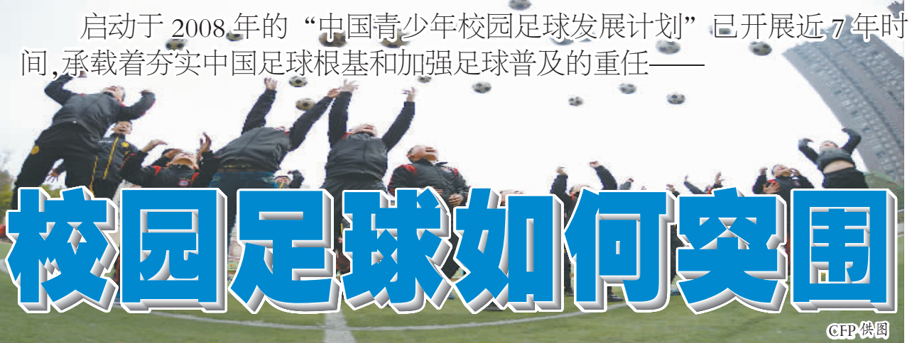
启动于2008年的“中国青少年校园足球发展计划”已开展近7年时间,承载着夯实中国足球根基和加强足球普及的重任——

近年来,中国足球尤其是国字号球队的持续低迷,将困扰中国足球多年的人才危机暴露无遗。为此,体育和教育部门携手开展校园足球,力图从中小学的青少年学生群体入手,逐步建立起完整的校园足球发展体系。“开展‘校园足球’既能提高青少年学生体质,也能为中国足球培养更多人才”,时任中国青少年校园足球发展计划执委会负责人曾对记者充满信心地表示。经过6年多的实践和发展,校园足球