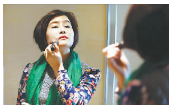
铁飞燕是一个爱美的“90后”。