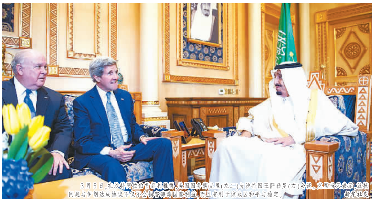
3月5日,在沙特阿拉伯首都利雅得,美国国务卿克里(左二)与沙特国王萨勒曼(右)会谈。克里当天表示,就核问题与伊朗达成协议不仅不会损害海湾国家利益,而且有利于该地区和平与稳定。