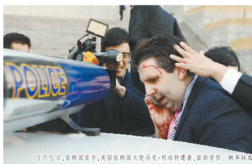
3月5日,在韩国首尔,美国驻韩国大使马克·利珀特遭袭,面部受伤。

另据韩国政府消息人士5日透露,由于负责韩美“关键决断”联合军演的韩美联合部队司令柯蒂斯·斯卡帕罗蒂要参加美国对此事件的善后工作,“关键决断”第一阶段演习被迫于5日上午提前结束。对此韩国国防发言人金珉奭当天表示,韩美仍将坚定不移地发展全面战略同盟关系,正在进行的联合军演将如期举行。