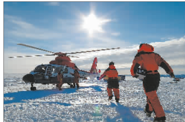
为前往昆仑站的队员搬运仪器设备。(2014年12月9日摄)