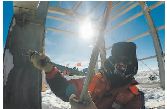
1月8日,昆仑站,队员冒着严寒、缺氧在工作。