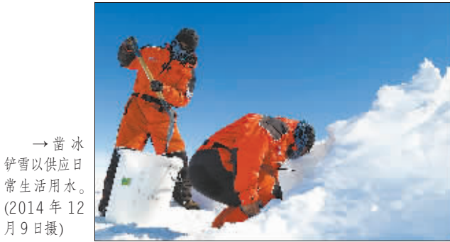
→凿冰铲雪以供日常生活用水。(2014年12月9日摄)