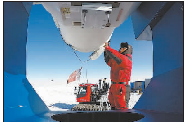
1月12日,昆仑站,队员在架设望远镜。