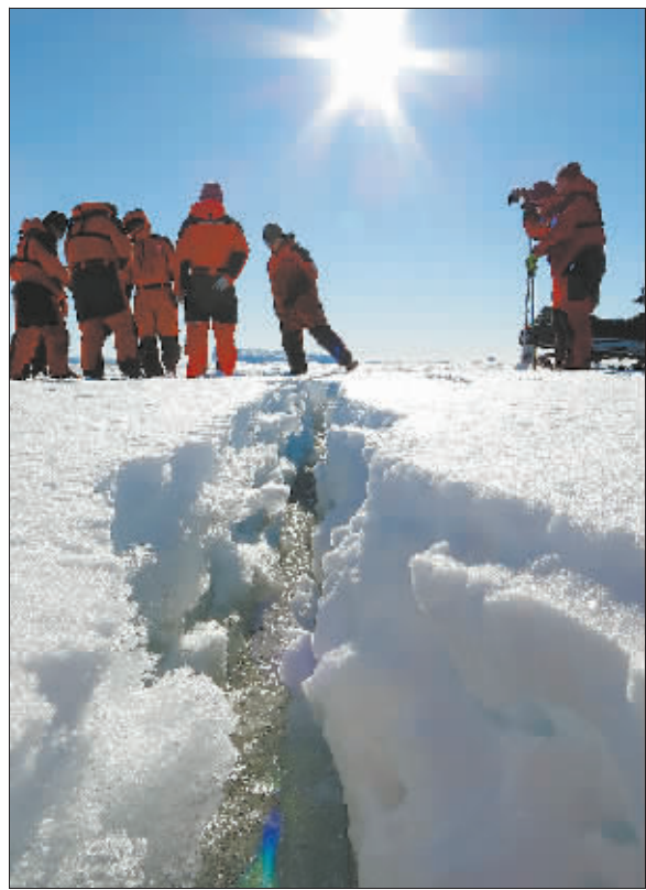
←探冰小组队员在测量冰缝的厚度,以保证雪地车安全通过。(2014年12月1日摄)