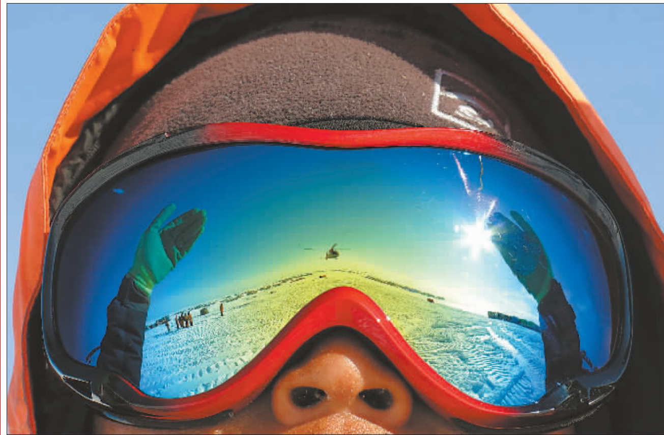
一位队员正在指挥运送物资的飞机降落。(2014年12月12日摄)