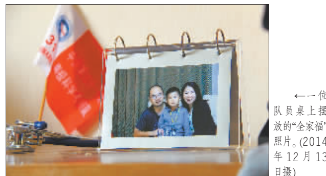
←一位队员桌上摆放的“全家福”照片。(2014年12月13日摄)