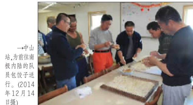
→中山站,为前往南极内陆的队员包饺子送行。(2014年12月14日摄)