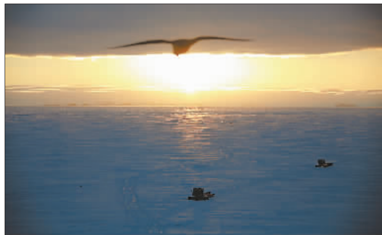
从飞机上拍摄的雪地车运输物资。(2014年12月3日摄)

163天,20000多公里, 275名科考队员离开家乡, 漂洋过海,怀揣中国梦, 追逐不落的太阳。