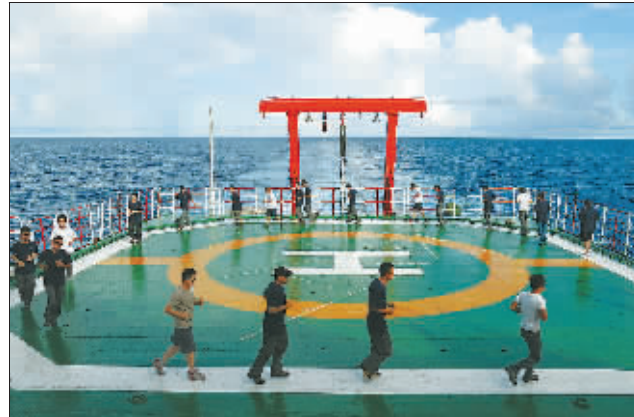
去往南极路上,每天一次甲板上的跑步锻炼。(2014年12月5日摄)