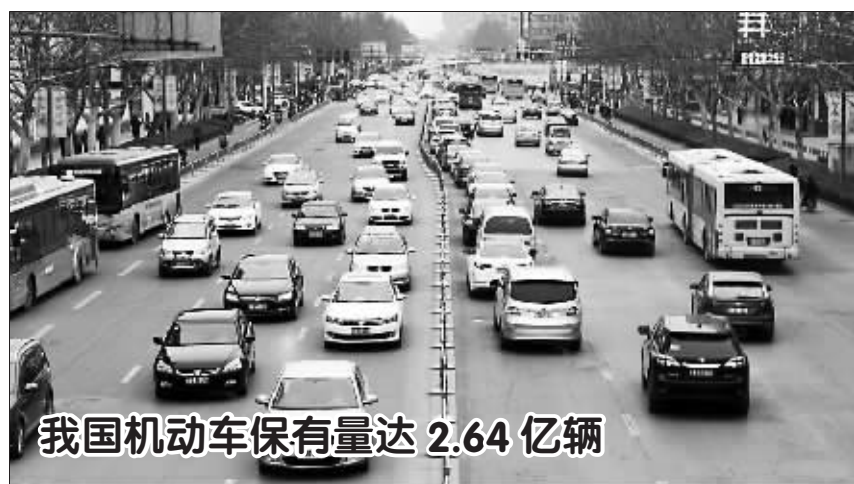
我国机动车保有量达2.64亿辆

有学者指出, 公交优先不能只停留在文件上, 需要全社会积极配合, 保障公交设施正常运转, 公交公司更要制定人性化管理举措, 避免僵硬考核, 同时加大对司机培训力度, 如此, 才有望让公交车从“霸王车头名”变成“守法车典范”。