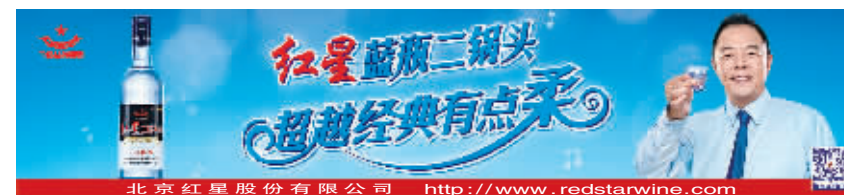
北京红星股份有限公司 http://www.redstarwine.com

杨栋梁提出,2015年要突出抓好五项重点工作:一是推动安全生产责任体系建设;二是要打好煤矿、油气输送管道隐患治理两场攻坚战,深入开展重点行业领域安全整治;三是狠抓治本和预防措施,加强应急管理;四是加快安全生产科技进步和企业基础管理;五是推进依法治安,深化打非治违,严肃事故查处。