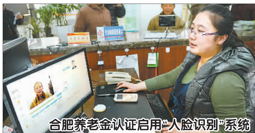
合肥养老金认证启用“人脸识别”系统

据了解,血库紧张的现象在全国普遍存在,为解决窘况,一些地区采取了无偿献血者免费乘坐公交、游览景区、优先就诊等政策鼓励献血。2014年10月起,南宁中心血站与企业联合,以幸运抽奖的方式,向献血者赠送轿车、手机等大礼,感恩和回馈无偿献血者。