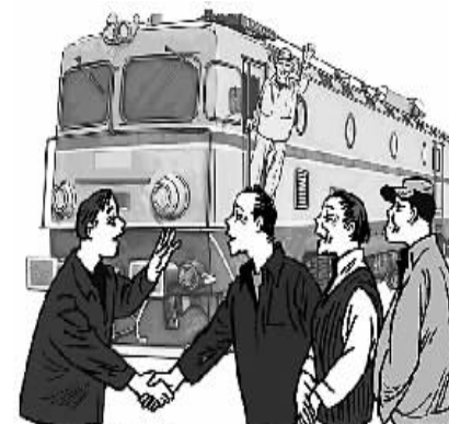
企业、家长共助成长 法明/画

“家长会”开过后,南阳机车队青工学习业务的积极性空前高涨,违章违纪大幅下降。“俺们得好好干,不能让单位操心,也不能让家长失望,下次‘家长会’上俺们希望听到更多的表扬……”青工毛竟宇的一番话代表了该机车队全部青工的心声。(张先锋)