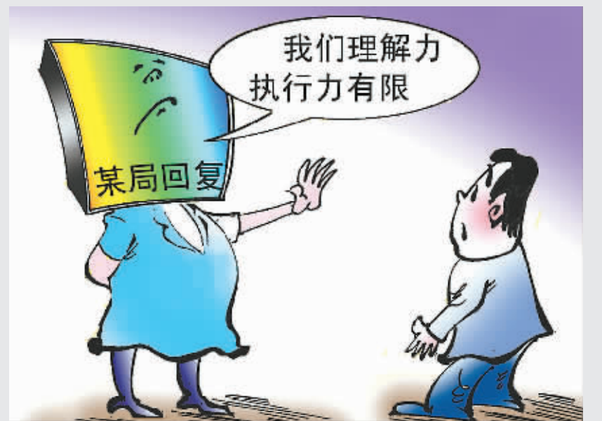
面对群众请求,某局抛出推脱“神回复”:我们理解力执行力有限。