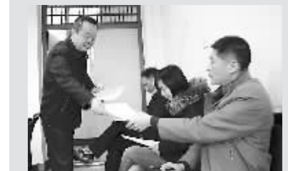
1月12日,河南油田采油一厂生产准备大队干部年度绩效考核工作拉开帷幕。

该段党委结合管辖区设备情况,分别在段管内建成了6个大学生培养基地,根据他们所学专业、性格特点和个人意愿,以五年为阶段,为入职的大学生量身定制了“五年职业导航规划”。第一年到现场实习锻炼,熟悉业务,提高技能;第二年担任班组长助理,参与班组管理,提高能力;第三年担任技术管理人员,参与车间各项生产,把理论与实践结合;第四年到段专业科室担任技术管理人员,重点培养应变能力,强化管理责任;第五年在段、车间任专业技术管理人员,拓展素质,促进成长成才。(王占军 王晋军)