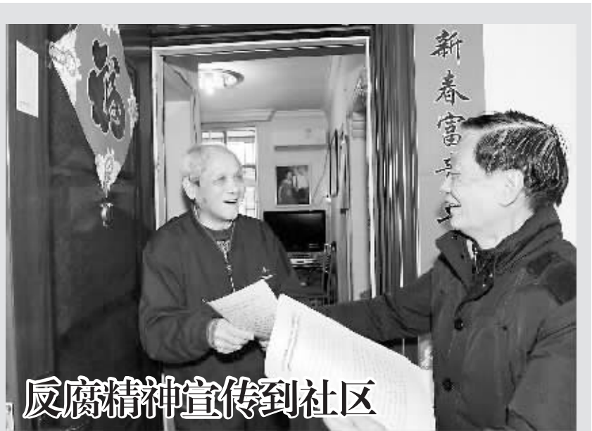
反腐倡廉精神宣传到社区

“一线员工工地上有多少土,干部脚上就粘多少泥。”这是该大队检测基层干部作风转变成效的一把标尺。大队党委从工作绩效、工作能力、工作作风等三个方面,对56名管理和技术干部进行考评,以此促进干部转变作风,推动企业和谐发展。