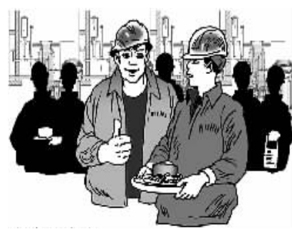
关心从实际改善开始 法明/画

该油站通过改进食堂管理和增添饭菜花样品种,尽量满足不同员工的饮食习惯,就餐员工都很满意。就是偶尔到外面聚餐的职工不但严格执行提前向班长打招呼的要求,而且严格掌握饮酒的度,再没有出现饮酒过量影响生产和身体健康的现象。(曹吉祥)