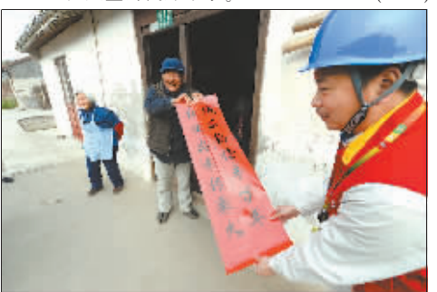
党团员志愿者为孤寡老人张贴对联,老人笑逐颜开

履行自己的社会责任。党团员志愿者通过定期走访、慰问老人,了解老人们的需求,主动为他们提供用电业务咨询、用电知识宣传、用电故障维修等便民服务,并在重要节日和特殊时段以赠送物资和提供供电志愿服务的方式,为老人们送温暖、献爱心,展示着责任央企的良好形象。(王燕)