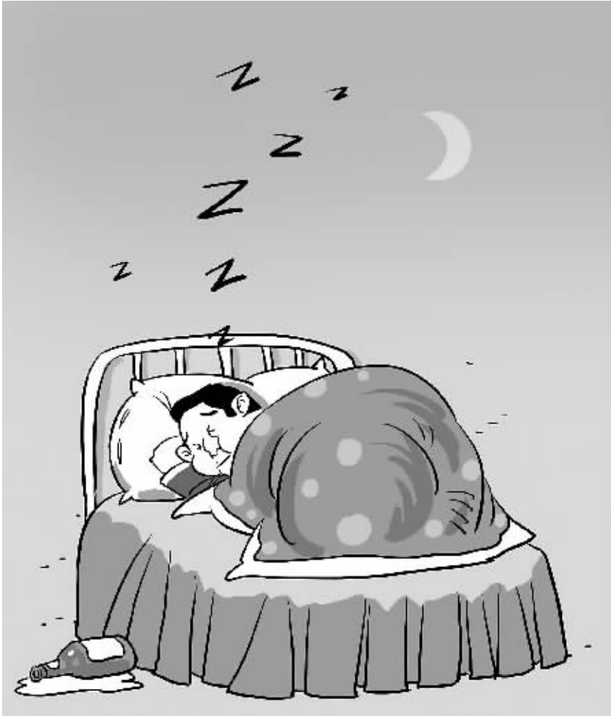
梦想是不会记得你说过的什么,它只会记得你做过什么。

记者在现场了解到,以专业从事青少年读物出版为己任的接力出版社在今年会以少儿文学、国学、少儿励志生存类图书为重点,将亲子互动阅读推广进家庭、学校。