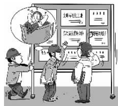
酣睡不醒 赵春青/画

没想到的是,项目部的荣誉墙撤掉没多久,在广东省高速公路有限公司开展的全省在建高速公路工程质量综合检查评比中,项目部又高居榜首。(苏菲 张勇)