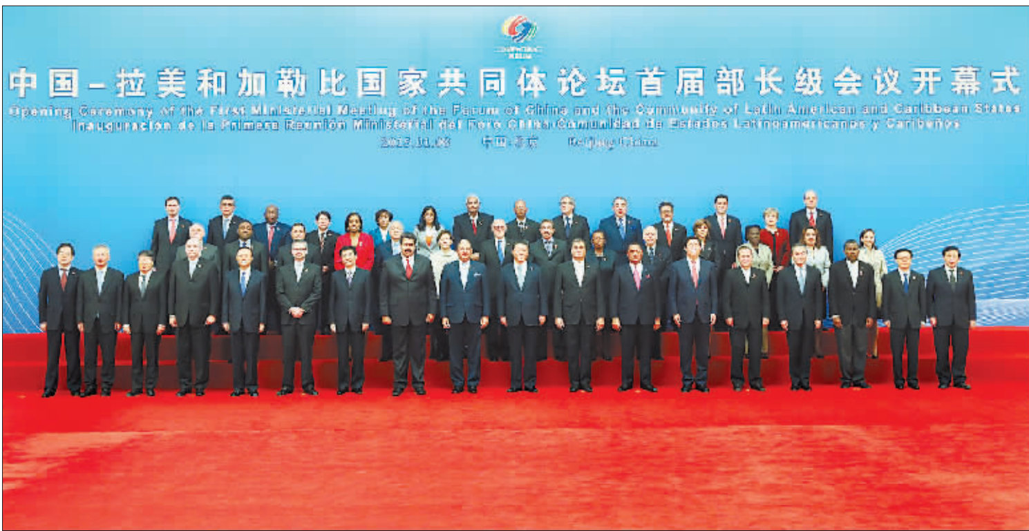
开幕式前,习近平亲切会见与会外国领导人及代表团团长并合影留念。