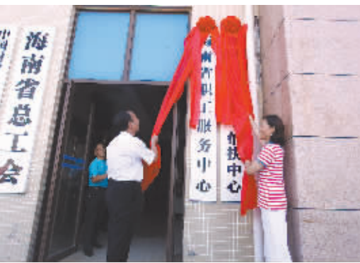
2014年9月30日，海南省职工服务中心挂牌成立，标志着海南工会帮扶系统将从单一的困难帮扶向困难救助、普惠服务和法律维权“三位一体”的职工综合服务体系转型升级

伴随着冬日里温暖的阳光，2015年的新年钟声即将敲响。作别2014年的精彩，2015年的海南工会将继续围绕党政工作大局，在新的起点上进一步当好职工群众最可信赖的“娘家人”。