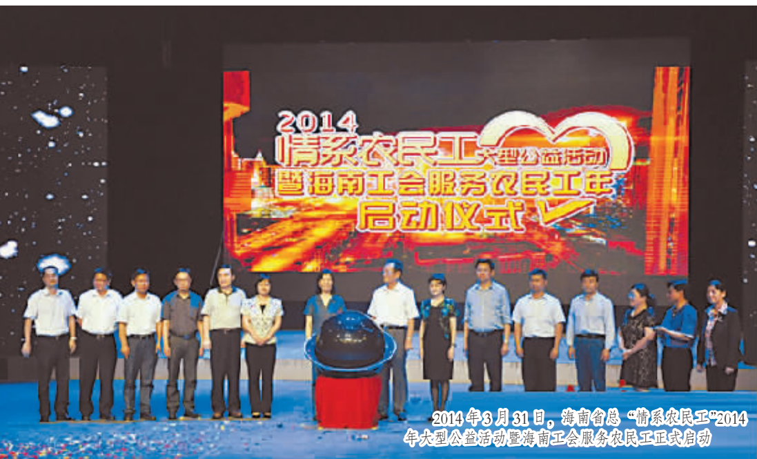
2014年8月31日，海南省总工会“情系农民工”2014年大型公益活动暨海南工会服务农民工年启动仪式

2014年，是海南工会不平凡的一年。这一年，在党的十八大、十八届三中全会精神和习近平总书记系列重要讲话精神的指引下，在省委、省政府的正确领导下，海南各级工会以党的群众路线教育实践活动为契机，以家庭经营理念经营工会，做群众最信赖的“娘家人”，让“职工之家”情暖万众——