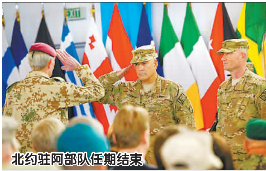
北约驻阿部队任期结束