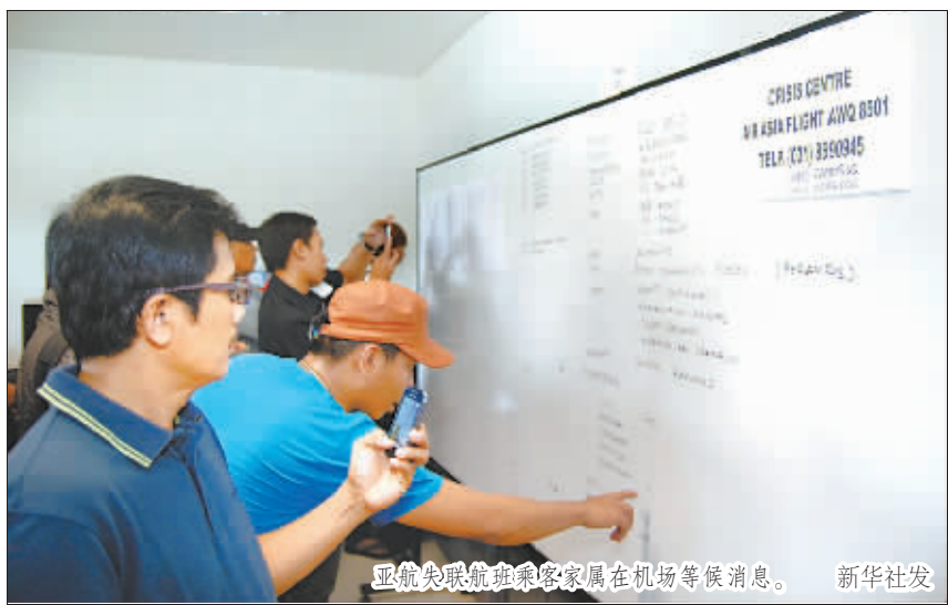
亚航失联航班乘客家属在机场等候消息。

新华社莫斯科 12月27日电 (记者陈俊峰 钟忠) 新任的白俄罗斯总理科比亚科夫 27日对媒体说,白经济的最大问题是对外部市场的高度依赖,当国际形势特别是周边国际形势出现动荡时,白经济就会遭受重大不利影响,政府将努力解决这一问题。