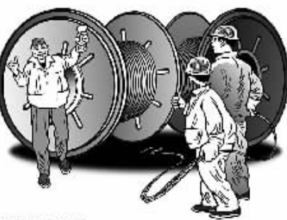
返还罚款 激励违章 法明/画

阶段的一种表现形式,对于现代企业来讲,已经是比较落伍的一种管理方法,因为它的持久性有问题。罚款只会减少问题行为,不能创造业绩,不会增加新行为和期望行为。