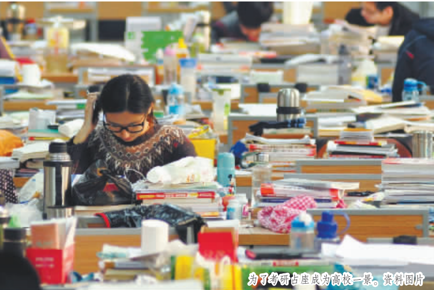
为了考研占座成为高校一景。资料图片