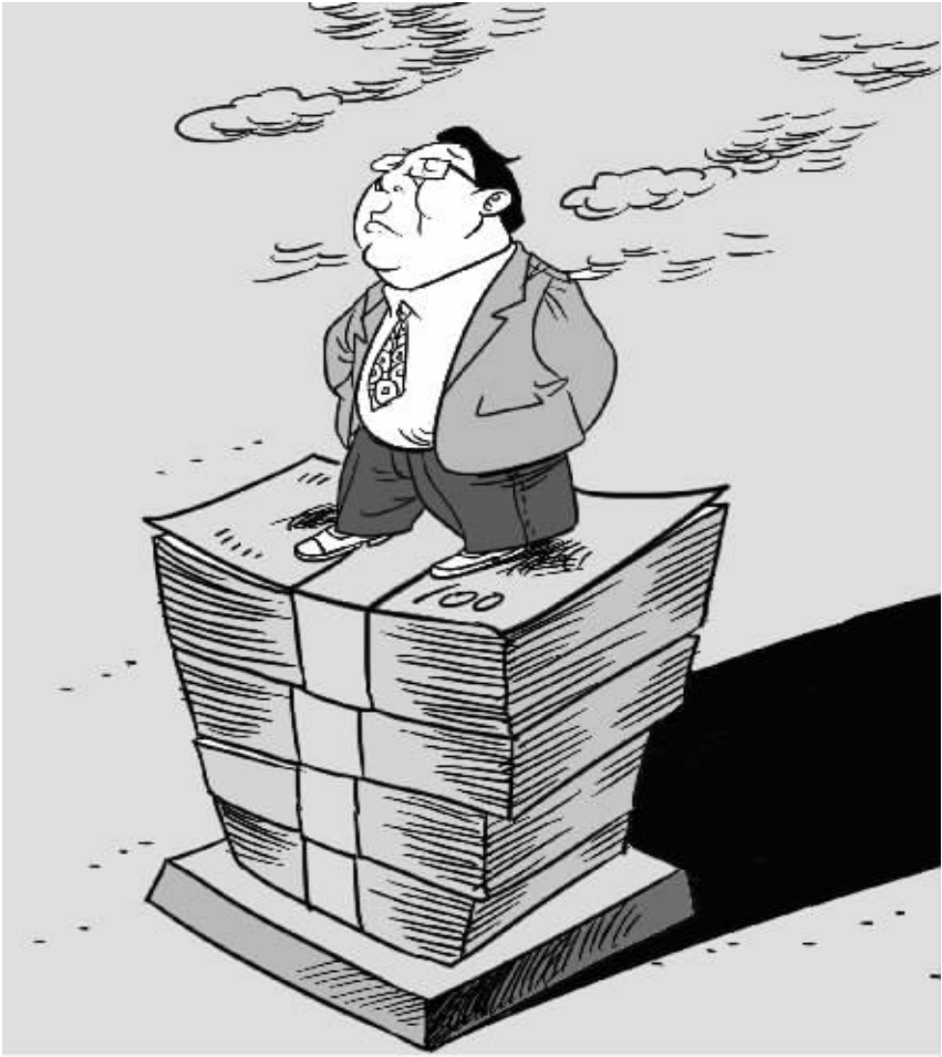
大部分人评判成功，只有两个标准：小时候的分数和长大后 的钱数。 赵春青画

企事业单位1756家，发现并治理了一般隐患2828个，重大隐患15个，淘汰S7系列高能耗型号变压器1400余台，拆除重要电力设施保护区内的违法建筑约4000平方米，投入整改资金近1300万元；电气火灾事故、停电事故、触电事故分别比之前下降了50%、55%、35%。 同时，针对余姚市供电公司发现的各类大小隐患，该市公安局等部门责令企事业单位及时整改。对于检查中发现的违法行为，有关部门根据情节轻重做出相应的行政处罚。 截至日前，余姚市安委办发文，该委为为期3年的企事业单位安全事故防范创新试点工作提前收官，整治成效显著。下一步，余姚市供电公司将继续积极主动配合市相关部门，深入做好对农村剩余电流动作保护装置安装工作的督查，认真推进重要电力设施保护区违法建筑整治，紧抓重点行业和部门的用电安全，并通过完善源头管理机制、联合执法机制和信息化监督机制，完善安全用电长效机制建设。