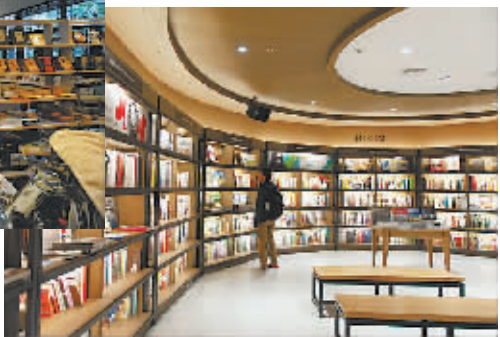
台北文化地标诚品书店