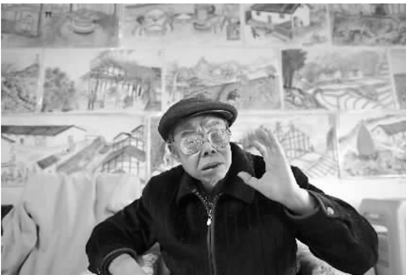
人们下地耕种,老人们在家手忙脚乱。”

赶场,“每月三六九赶场,是最热闹的。大家拿着自家种的粮食去置换,吆喝声、嬉闹声、讨价还价声充斥整个村镇。”童年,“放学后,记得我们这样的男孩就围在一起下六子棋,称六子冲杀;女孩子放羊,看羊儿斗角嬉戏。”忙农活,“有小孩的家庭,母亲陪着给孩子喂奶,或者把孩子背在背篓里,跟着男人们一起劳作,没上学的小孩到处追打,男