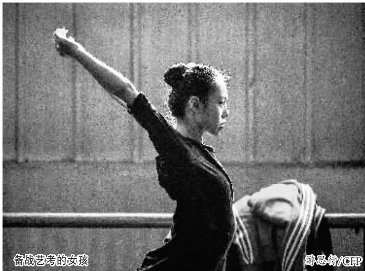
备战艺考的女孩

据记者了解,除北京少数几家艺考机构在全国范围招生外,大部分艺考培训机构的辐射范围超过自己所在的市级辖区,辐射全省的都较为少见。“可能因为艺考考生还是高考考生中的小众。”这位负责人表示,目前艺考市场没有领头羊式的企业,缺乏明确的行业秩序和游戏规则,小作坊式的培训机构各自为战,因此乱象丛生。