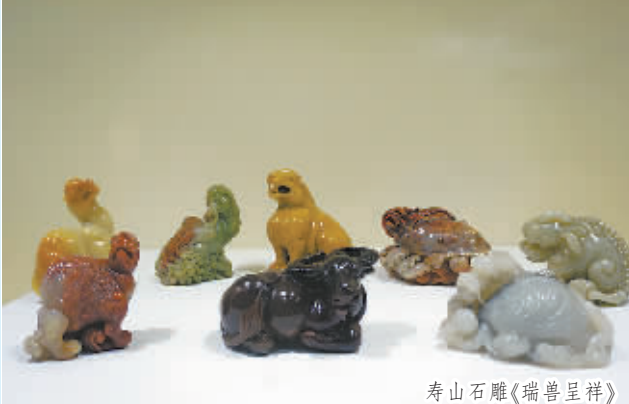
寿山石雕《瑞兽呈祥》