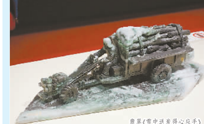
翡翠《雪中送炭得心应手》

根据规划,项目总占地范围22.31公顷,总建筑面积约35万平方米,计划于2016年底建成竣工。据介绍,基地先导区作为整个项目的运营试验区,现已完成基础设施建设,并计划在年底启用。先导区将引入国内外具有代表性的出版企业和公共管理服务机构;每年举行各类行业论坛、学术交流活动;承办艺术、音乐、游戏等新品首发仪式;推出各类与艺术、音乐、广告等相关的展览与节庆活动,促进出版、文化、创意产业的融合发展。