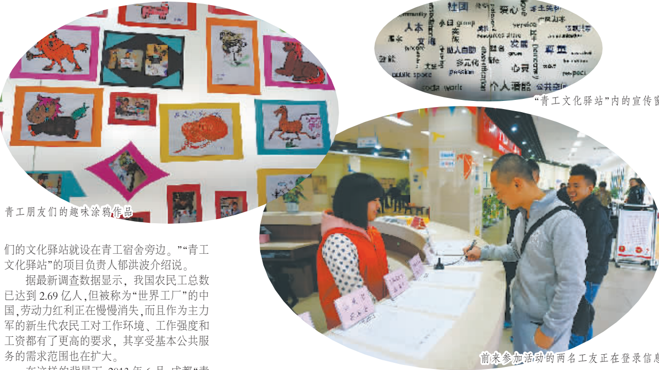
青工朋友们的趣味涂鸦作品

“我们这个‘青工文化驿站’建在成都的重大项目产业社区内,是外来务工人员的主要聚集地。富士康、中光电子、英特尔等制造业公司都在这个区域,常年平均员工人数达5万至6万。为了满足他们的业余文化生活,我