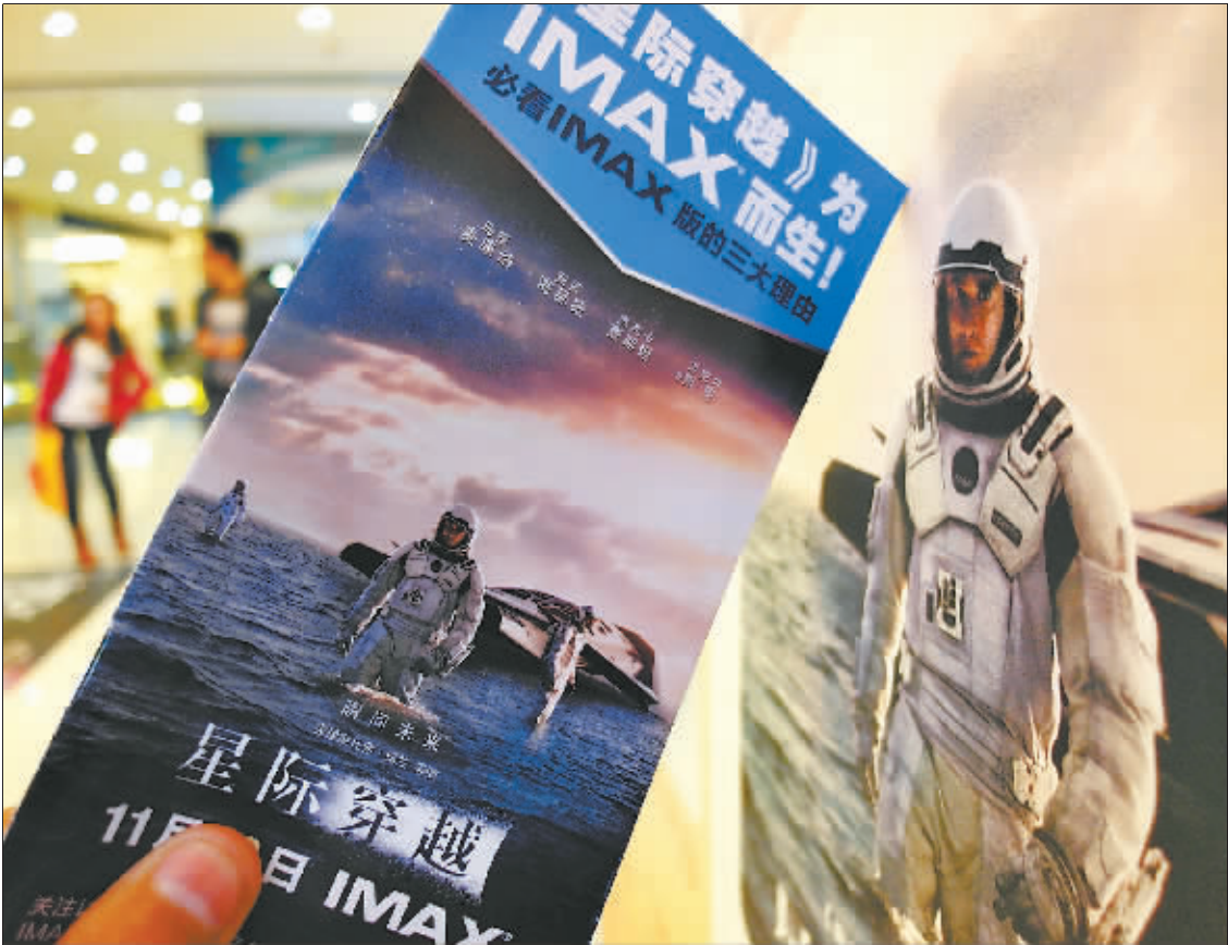
随着好莱坞科幻大片《星际穿越》热映,国内电影市场近期掀起了一股“科幻风”。

但在中影老总韩坤看来,现在正是拍科幻片的时候。他在项目推介会上提到了今年电影票房将超过 300 亿元,电影产业的大