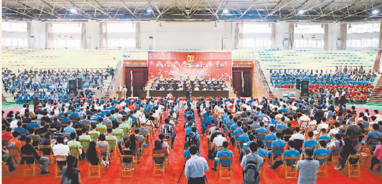
自治区总工会举办广西技能状元大赛。