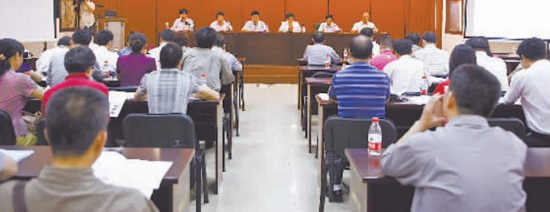
柳州市举办创建先进模范职工创新工作室现场推进会。

在固本强基提升水平上主动作为。通过“党建带动工建、工建服务党建”,全市基层工会组织数从3590家增加到9174家,工会会员数由60.65万人增加到83.13万人。加大县(区)及乡镇(街道)工会标准化建设力度,共有7个县(区)获自治区“县(区)工会标准化建设先进单位称号”,鱼峰区天马街道工会联合会获“全国百示范乡镇(街道)工会”称号。5年来,柳州工会获10个国家级工会荣誉称号,29个自治区级工会荣誉称号,有8项工作成果获全区工会优秀创新成果和创新成果奖。