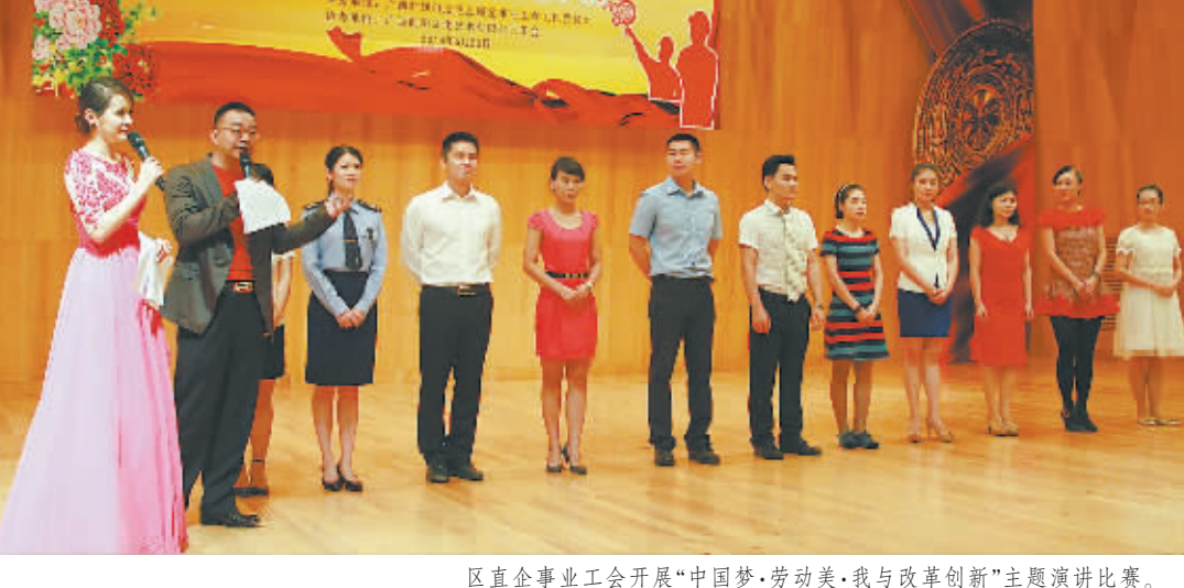
区直企事业单位开展“中国梦·劳动美、我与改革创新”主题演讲比赛。

评先评优硕果累。一是认真抓好全国、广西五一劳动奖状(章)、工人先锋号、五一巾帼标兵的评选推荐工作,劳模组队参加“广西技能状元”大赛,将基层涌现的先进典型挖掘出来,充分发挥先进典型的正能量引导作用。二是积极指导基层工会创建“劳模创新工作室”、“女职工创新工作室”及“职工书屋”。近3年来,共建成“劳模创新工作室”2个,“女职工创新工作室”1个,“职工书屋”39个。