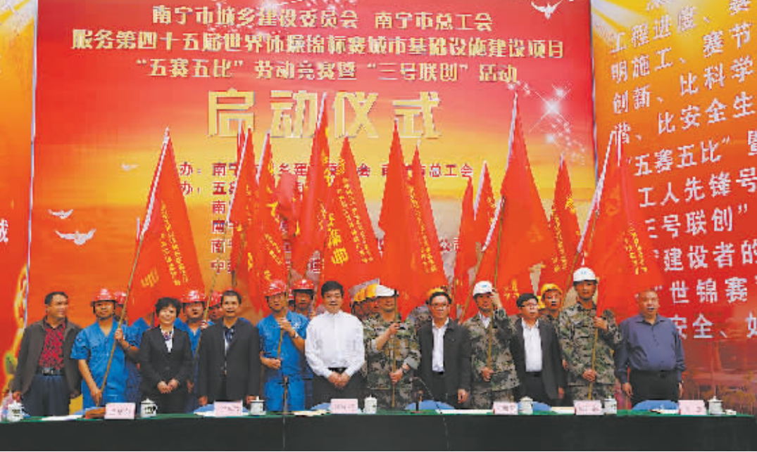
南宁市总工会举办服务第四十五届世界健美锦标赛劳动竞赛。

深入开展职工文化“进基层、进车间、进工地”活动,5年来共举办送文化活动1000多场次,建设职工书屋226个,举办第六届职工体育运动会,各类群众性体育与活动超过1000场次,打造了富有南宁特色的职工文化品牌,与市文化局和市建委联合举办十届“农民文化节”。