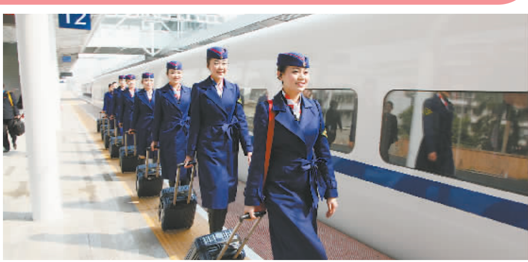
南宁铁路路局工会开展安全出行、方便出行、温馨出行“劳动竞赛活动”。