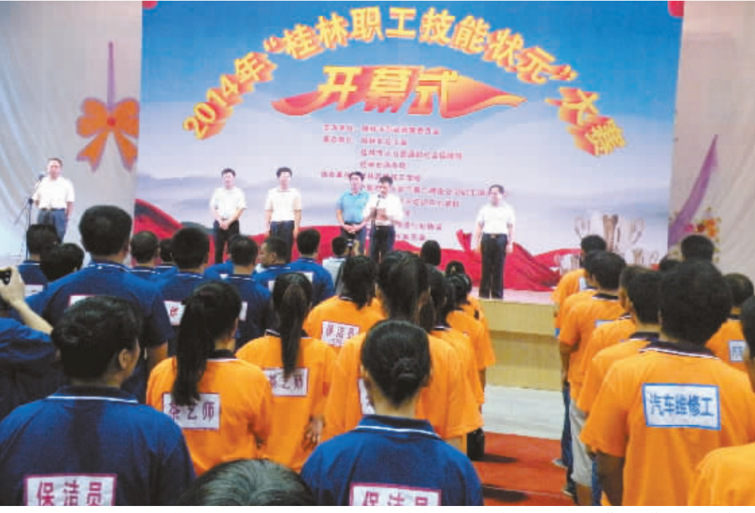
桂林市组织全市职工开展汽修工、汽车维修工、育婴师、保洁员、烹饪等职工技能状元大赛。

开展创新社会管理“五个一”活动。桂林市总工会从2012年开始“五个一”活动试点工作,即建一楼宇工会、帮一帮困难职工、管一管治安卫生、抓一抓文体活动、访一访左右邻居。据统计,近两年来,在全市109个社区普遍开展“五个一”活动,开展职工志愿服务、义务清扫街道、交通文明劝导、帮扶救助、组织职工培训、宣传讲座、百姓大舞台和社区文艺演出等各项活动228次(场),参加职工群众26万人。曾经邻里关系淡漠、人际意识淡薄的社区,因为工会和社区共同组织开展社区邻里节、周末文体比赛和职工群众文艺联欢活动,变得融洽和谐起来。“五个一”活