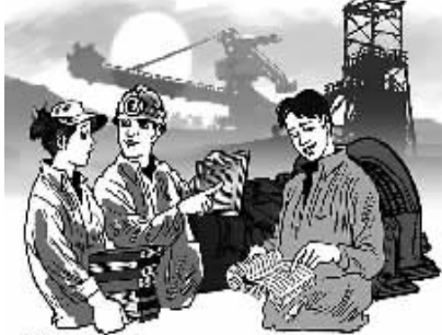
读书氛围重在营造 法明/画

尬,但由被动到主动,通过读书来提高员工的思想和文化素质,慢慢地让读书成为职工自觉自愿的一种习惯,在书香中寻找乐趣、陶冶情操,完善自我,让书香成为一种美丽。