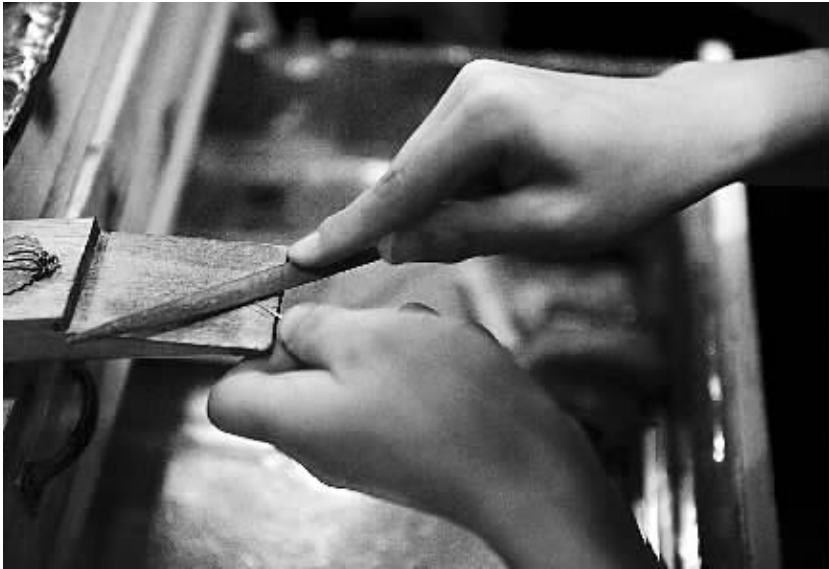
珠宝工艺师将压片后的金条磨尖。

正是出于对定制概念的情有独钟,庄琼琼选择了“用色彩定制珠宝”这一设计理念,在她的作品里常能看到南红与青金石、