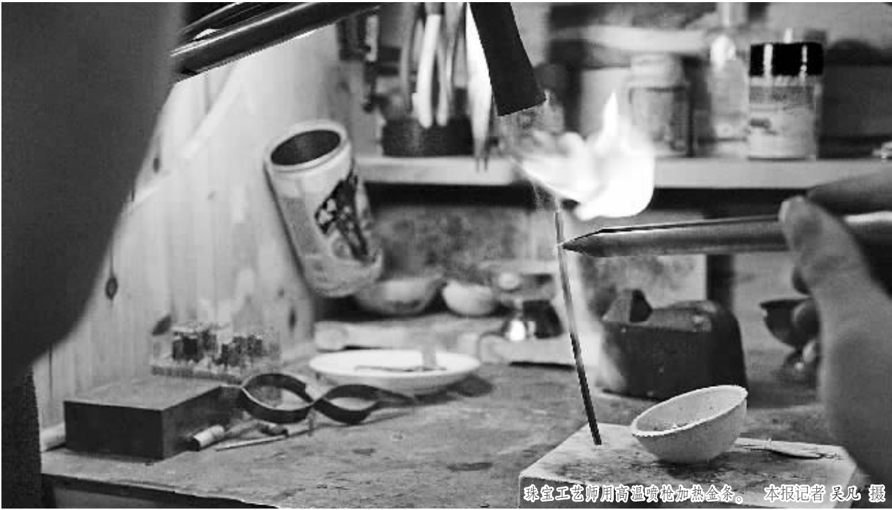
珠宝工艺师用高温喷枪加热金条。