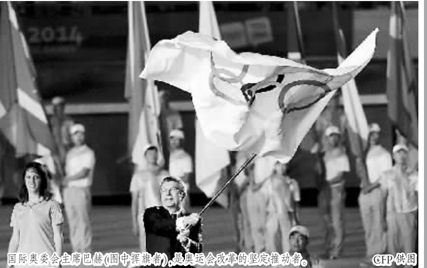
国际奥委会主席巴赫(图中挥旗者)，是奥运会改革的坚定推动者。

早在1996年便当选国际奥委会执委，随后又长期担任国际奥委会副主席的巴赫，早已注意到奥运会及奥林匹克运动所存在的不足和问题。国际奥委会在现阶段大力推行改