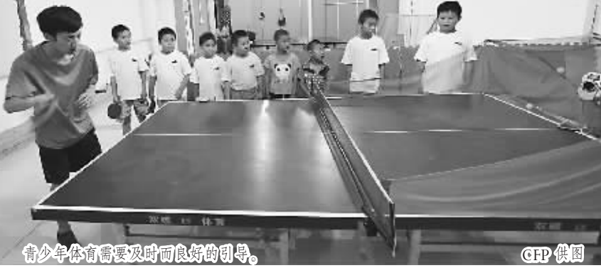
青少年体育需要及时而良好的引导。

位，排名虽较为靠前，但总产值却与排名第一的广东省有较大差距，这就决定了湖南省不可能走大投入的道路。而是将有限的资金用于抓特色和强项上，特别是在探索体教结合的模式上下功夫。