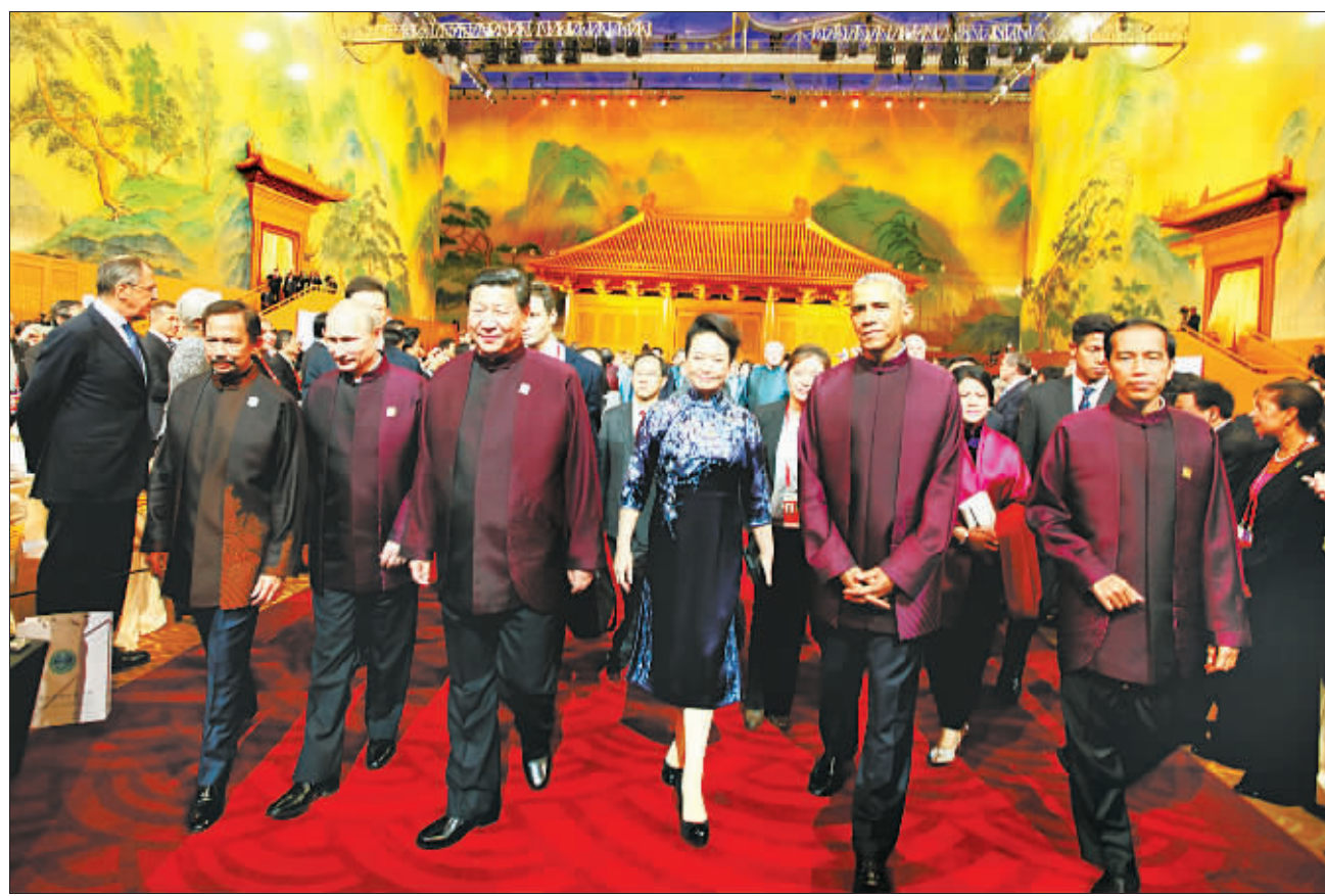
11月10日晚,国家主席习近平和夫人彭丽媛在北京国家游泳中心(水立方)举行宴会,欢迎出席亚太经合组织第二十二次领导人非正式会议的各成员经济体领导人、代表及配偶。这是领导人步入宴会大厅。