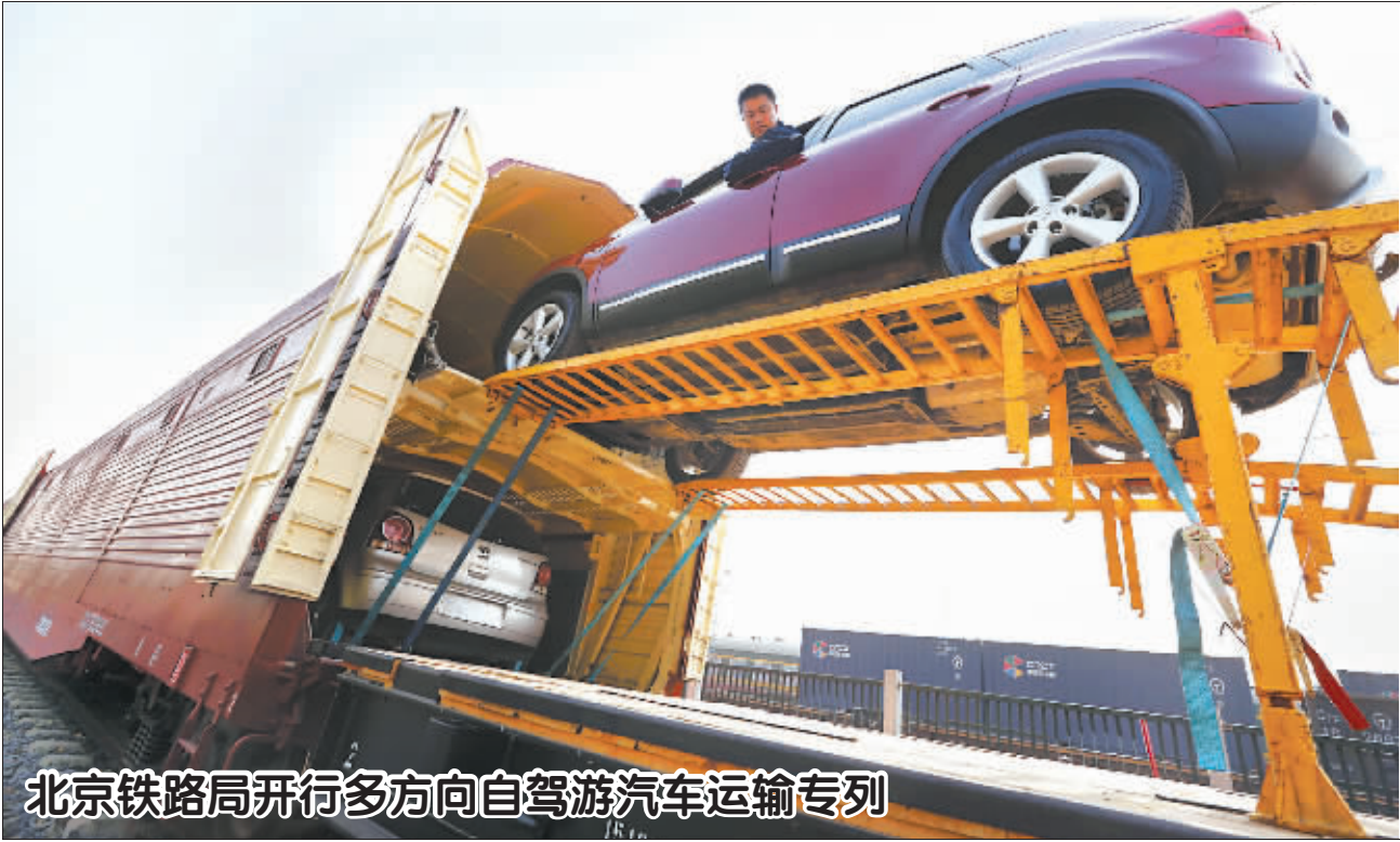
11月4日,北京大红门货运站,首批去成都自驾游的车装箱出发。2014年亚太经合组织(APEC)领导人会议周放假期间,北京铁路局将开行浙江、四川、江西、湖南、陕西、湖北等6个方向的自驾游汽车运输专列。林辉 摄/CFP

【本报北京11月4日电】(记者王冬梅)国家安监总局新闻发言人黄毅今天在新国办举行的新闻发布会上介绍,1-10月份,全国各类事故总量和事故死亡人数同比分别下降2.6%和8.8%,较大事故实现了由升转降,重特大事故同比减少12起,下降了25.6%。特别是煤矿,已经连续19个月没有发生特别重大事故,煤炭百万吨死亡率已经降到0.25,安全生产的其他指标也都好于去年同期。 黄毅说,在以“六打六治”为重点内容的打非治违专项行动部署后,到9月底,全国各地打击治理的非法违规行为达到了50.7万起,其中对严重的非法违法行为,近7000件