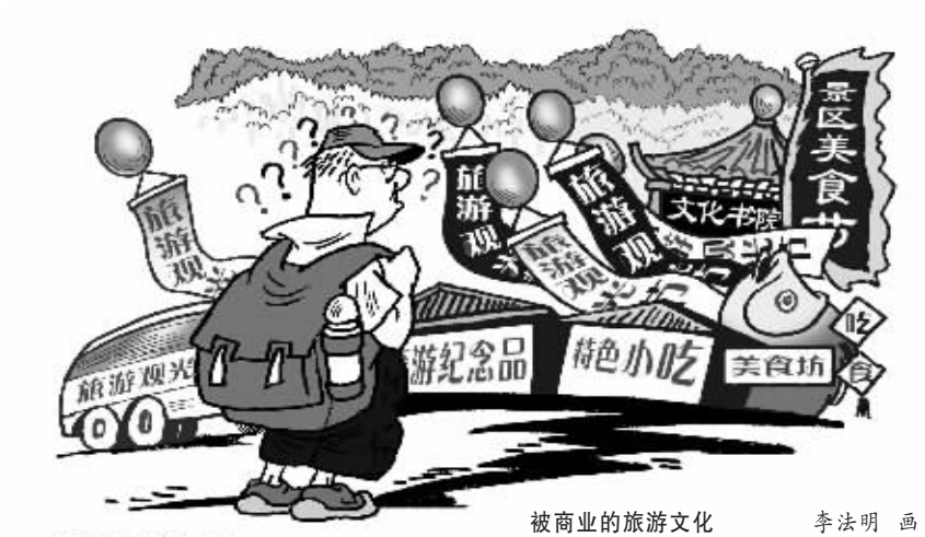
被商业的旅游文化