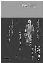
梁漱溟著 上海人民出版社

本书是有“最后的儒家”之称的梁漱溟先生现存全部日记(近80万字)的汇编，并附数十张首次公开的珍贵私家历史照片。现存日记始于1932年，终于1981年，历经“文革”抄家等磨难得以留存。著者早年投身乡村建设，巡视抗战敌后，调停国共两党争端，上谖云山闭关修佛，解放后参观城乡新变与土地改革，“文革”抄家受辱，长年坚持著述修行等等。长达50年的行止经历及感受心境，在日记中都有朴实的记录。本书是梁漱溟日记首次完整单行，编者撰写了导读性质的前言和每一年大事提要，修订及增补注释600余条，并编制主要人名索引近2000条。50年实录与独白，正是新旧中国半世纪国运缩影。