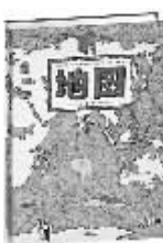
【波】亚历山德拉·米热林斯卡 丹尼尔·米热林斯基 著 贵州人民出版社

这是一本不同于一般的地图，它绘本式地介绍了7大洲、4大洋、南北极和42个国家，呈现了边界、城市、河流、险峰，有代表性的动物、植物、历史、人文名胜、文化事件和很多与当地有关的奇妙趣闻。它以引人入胜的细节、柔和别致的时尚色彩、俏皮的笔触，描绘出了地球的可爱，是儿童认识地球和世界的工具性绘本，是为地图爱好者奉上的一场视觉盛宴。20多个国家争相引进：荣获英、法、意多国图书大奖；美国上市首日1万册售罄。每一页都是一封环游世界的邀请信。