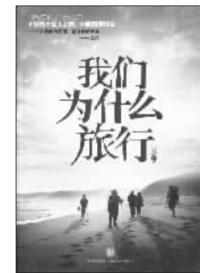
傅真《我们为什么旅行》

丁敏偶尔会看一点旅游图书，大多是游记类的，“指南攻略都是靠网络，可惜游记类图书有特色的太少，书名很煽情，内容未必好。”最近她在看的一位叫傅真的旅行家写的《最好金龟换酒》，感兴趣的原因很简单：“作者的个人经历和旅游目的地，她的南美游记还不错。”