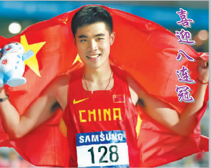
9月30日,中国选手谢文骏在亚运会田径男子110米栏决赛中,以13秒36的成绩夺冠。这是中国选手在亚运会上连续第八次夺得该项目冠军。